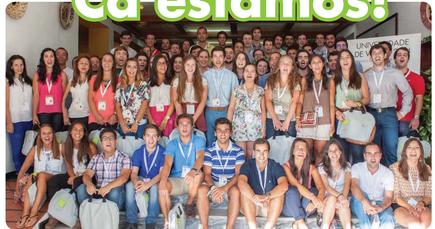
São jovens, bem-dispostos, gostam de política, vieram de todo o país para aprender e fazer amigos. São os participantes da UV 2014 e já estão em Castelo de Vide!