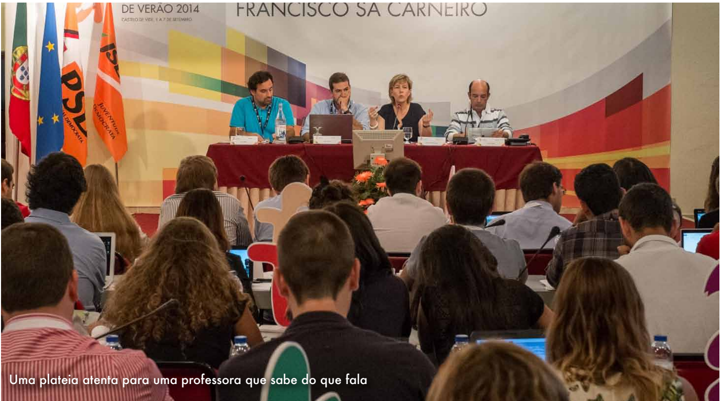
Uma plateia atenta para uma professora que sabe do que fala

Uma manhã à conversa com quem sabe de finanças, Ministra Maria Luís Albuquerque.